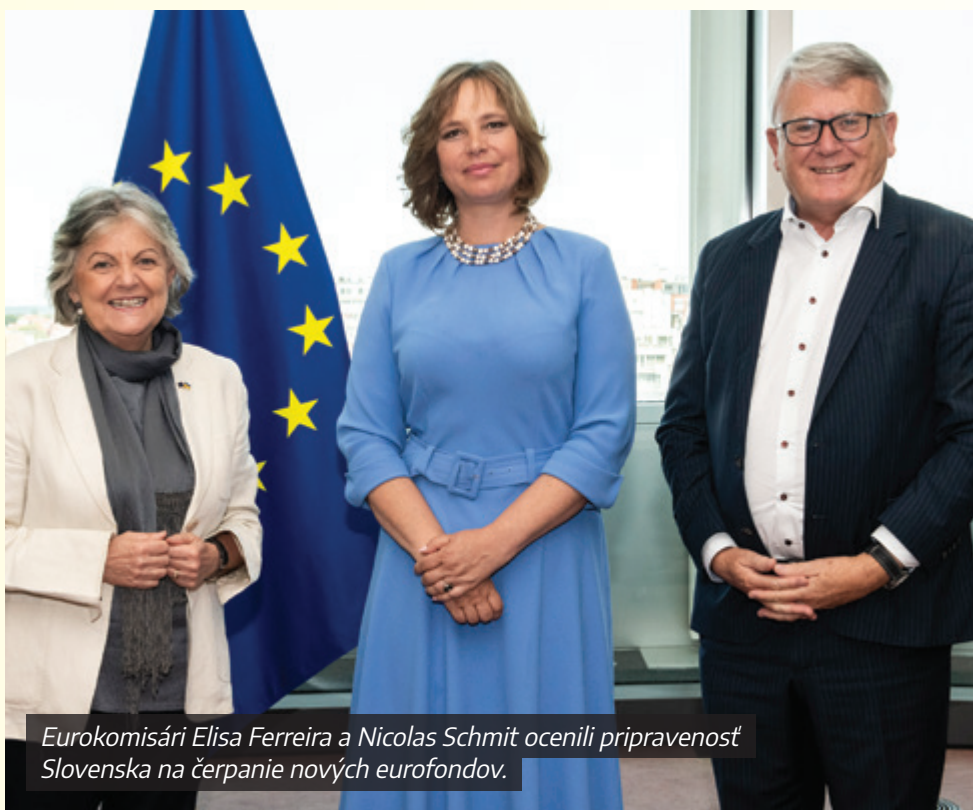
Eurokomisári Elisa Ferreira a Nicolas Schmit ocenili pripravenosť Slovenska na čerpanie nových eurofondov.

Eurofondy pre lepší život ľudí a prosperujúce Slovensko! Dva roky tvrdej práce na veľkej reforme eurofondov a náročných rokovaní s Európskou komisiou o novom programovom období máme úspešne za sebou. Európska komisia nám schválila nový Program Slovensko, a tak už onedlho budeme môcť začať využívať takmer 13 miliárd eur z nových eurofondov.