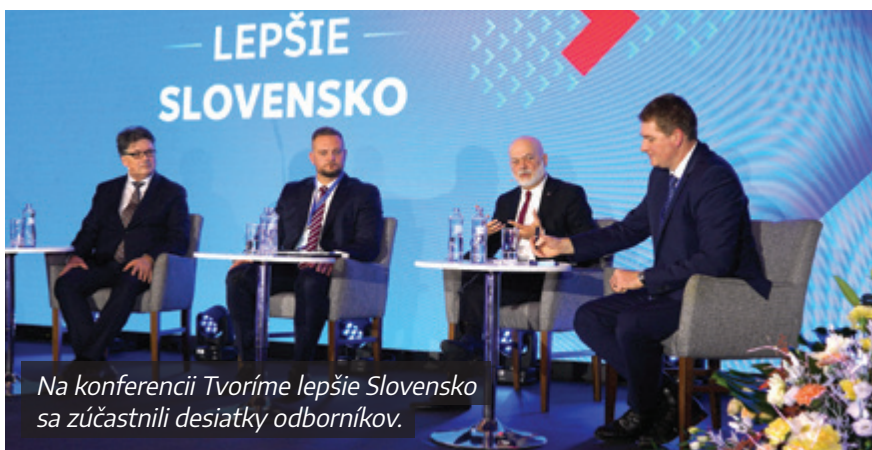
Na konferencii Tvoríme lepšie Slovensko sa zúčastnili desiatky odborníkov.

ale zároveň možno aj poslednou šancou, ako sa naplno rozbehnúť.