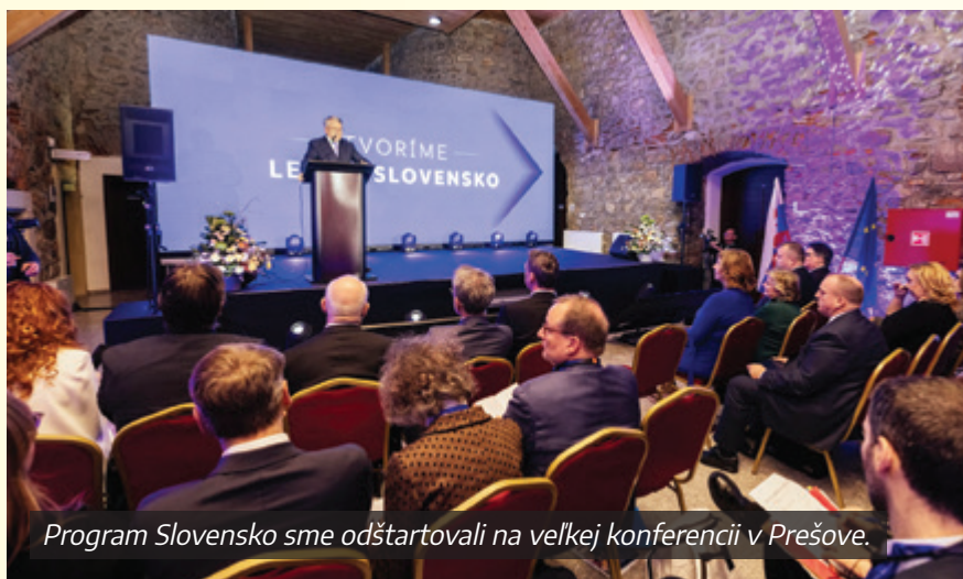
Program Slovensko sme odštartovali na veľkej konferencii v Prešove.

Program Slovensko, ktorý zároveň prináša najväčšiu reformu eurofondov v histórii, predstavila vicepremiérka a ministerka investícií Veronika Remišová v Prešove na konferencii s názvom „ Tvoríme lepšie Slovensko “. Prítomní boli tiež komisári Európskej komisie Elisa Ferreira a Nicolas Schmit, členovia slovenskej vlády, zástupcovia samospráv a ďalší hostia.