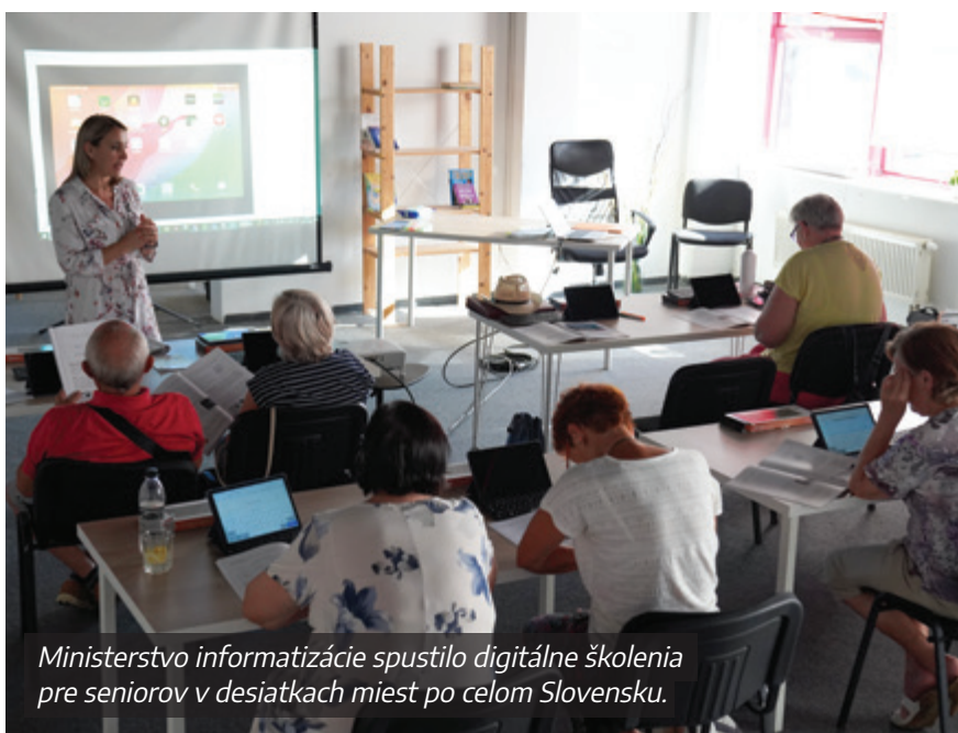
Ministerstvo informatizácie spustilo digitálne školenia pre seniorov v desiatkach miest po celom Slovensku.

Samozrejme, ak im niekto ukáže, ako na to, tak sa to naučia. Starý človek číta to, čo mu ponúkne rodina, nevie si sám naťukať objektívne správy. A keďže sa sám nedokáže dostať k relevantnému zdroju, uverí tomu, čo mu je podstrčené. Ak by to vedel, študoval by aj kvalitné zdroje informácií, som si tým istý.